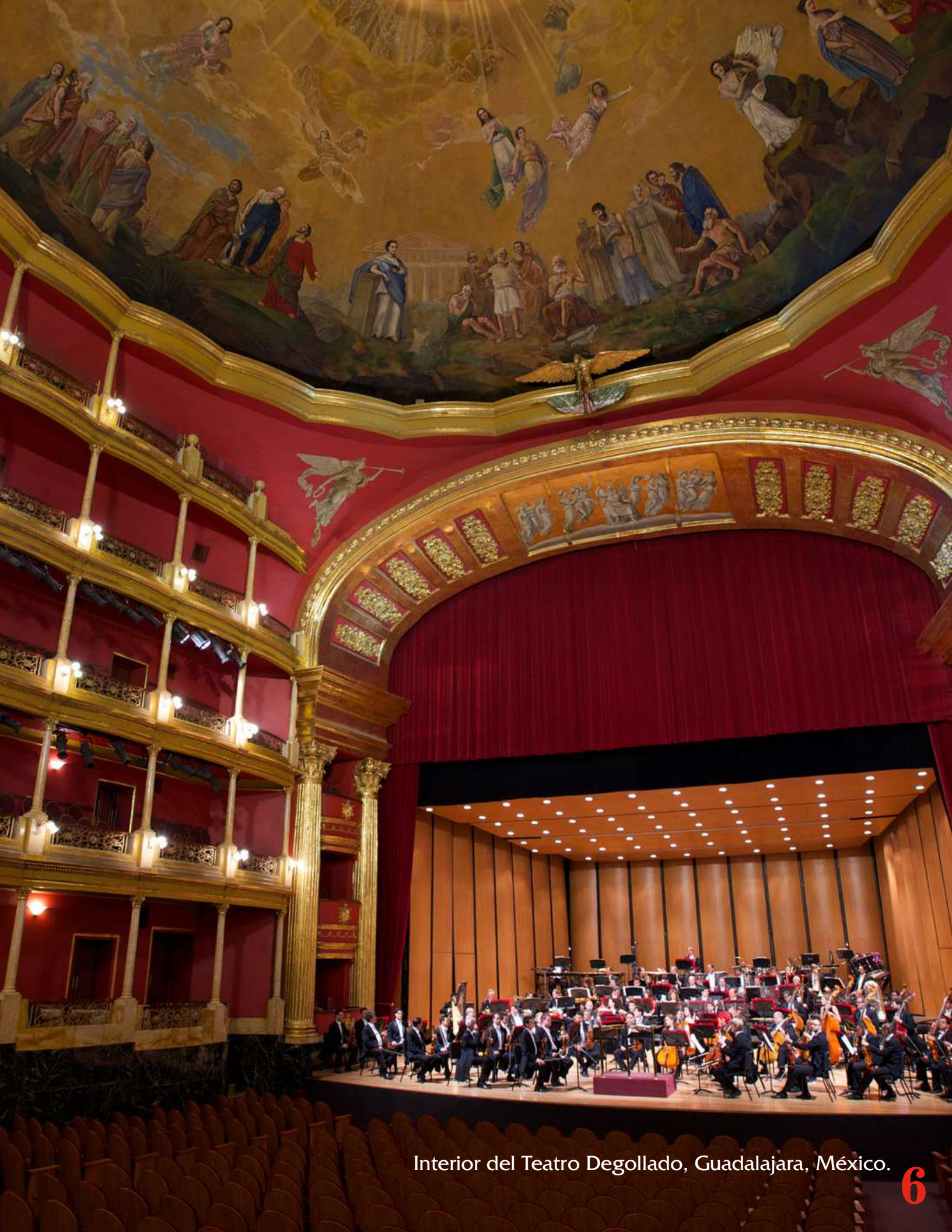
Interior del Teatro Degollado, Guadalajara, México.