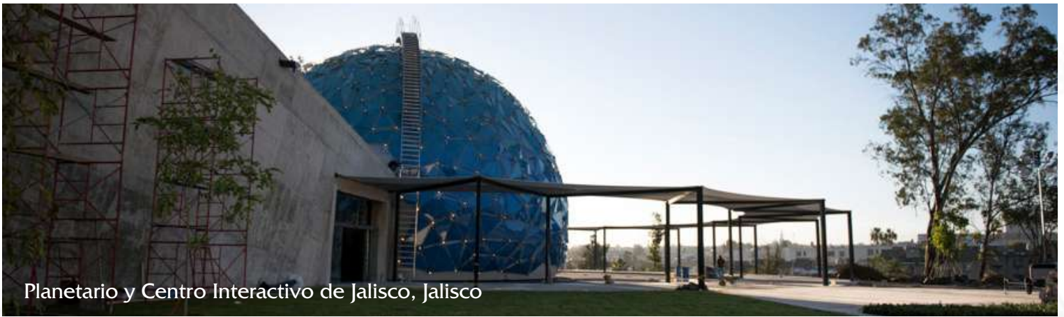
Planetario y Centro Interactivo de Jalisco, Jalisco