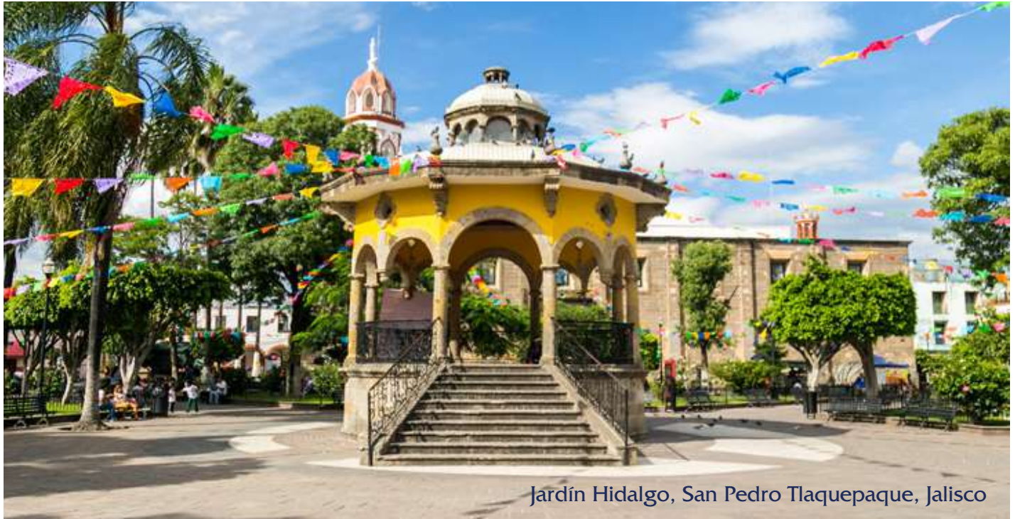
Jardín Hidalgo, San Pedro Tlaquepaque, Jalisco

Este lugar declarado Pueblo mágico desde el 11 de octubre de 2018, y cuyo nombre oficial es San Pedro de Tlaquepaque, es un poblado con una gran historia que contar, habitado desde la época prehispánica, pertenecía al Reino de Tonalá, gobernado por la Reina Chihualpilli. Con la llegada de los españoles, vinieron epidemias con lo que disminuyó la población a casi 100 habitantes en 1600, pero rápidamente se reconstruyó con los edificios más importantes del lugar, el Santuario de Nuestra Señora de la Soledad y la Parroquia dedicada a San Pedro, que es el Santo Patrono de la Ciudad.