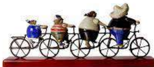
Escultura "Familia Corazón", Rodo Padilla

Estudió en la Universidad de Guadalajara donde se graduó en Ingeniería Industrial. Se especializó en cerámica de alta temperatura en Tokyo y Nagoya, Japón. Realizó cursos de diseño en Argentina e Italia.