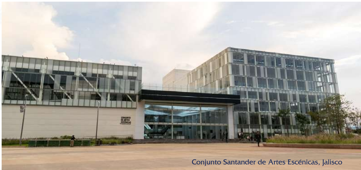
Conjunto Santander de Artes Escénicas, Jalisco

4. Es necesario discontinuar los cursos presentados anteriormente en congresos que muestren una pobre asistencia, bajas evaluaciones por parte de los asistentes o del Comité Organizador. A los profesores a quienes se les detecte alguna de estas situaciones, les será notificado oportunamente para que puedan modificar su curso de manera apropiada. Los miembros del Comité Científico discutirán los cambios y, sólo en caso de ser aprobado el curso con las modificaciones pertinentes, se podrá aceptar para su presentación.