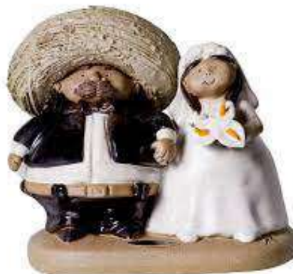
Escultura "Novios", Rodo Padilla