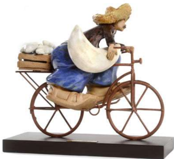
Escultura "Me robé una luna mini", Rodo Padilla