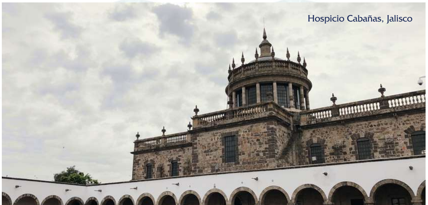
Hospicio Cabañas, Jalisco

En 1980 se decide el cambio de vocación del edificio. Durante un periodo de dos años el hospicio es objeto de trabajos de restauración y acondicionamiento para servir como centro cultural y museo.