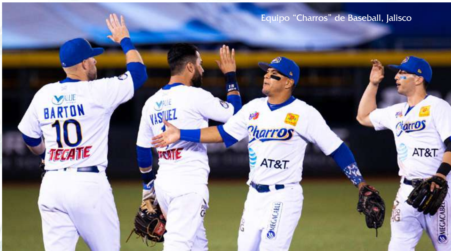
Equipo "Charros" de Baseball, Jalisco