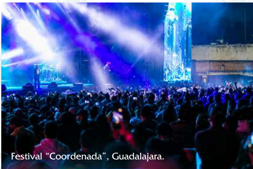
Festival "Coordenada", Guadalajara.

9. Los resúmenes/abstracts de los trabajos y los carteles serán publicados previos al congreso en un suplemento especial de la Revista Anales de Otorrinolaringología Mexicana. Los resúmenes que se entreguen fuera de esta fecha o en un formato distinto al solicitado no serán contemplados para su publicación en esta edición especial.