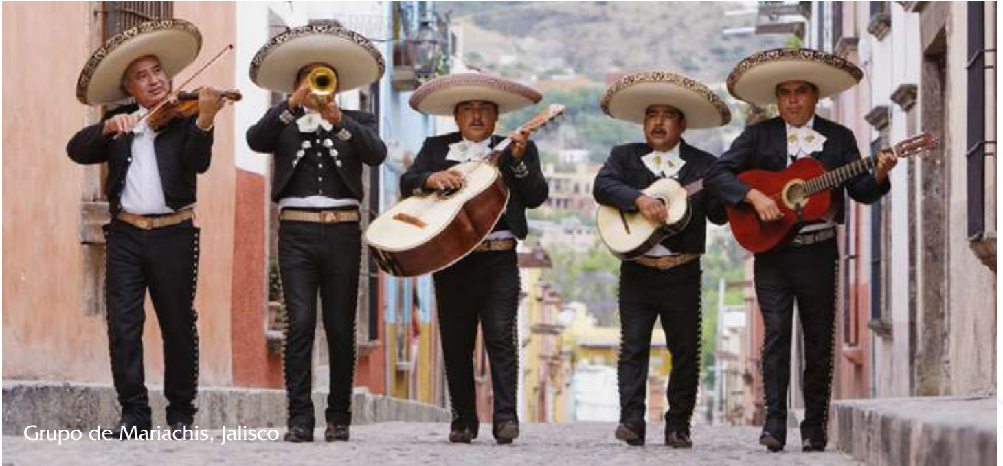
Grupo de Mariachis, Jalisco

El mariachi es un referente de la música tradicional mexicana. Declarado por la UNESCO, patrimonio cultural inmaterial de la Humanidad, desde el 21 de enero 2020.