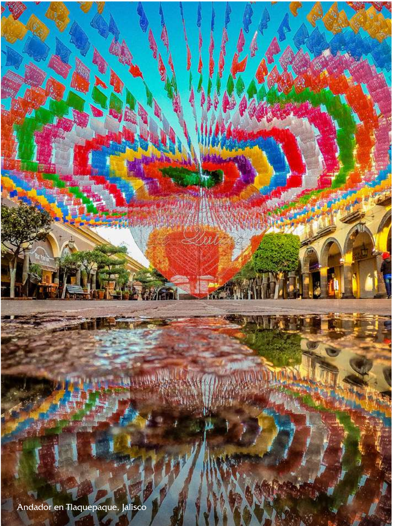
Andador en Tlaquepaque, Jalisco